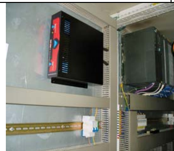
STS EMP 1109 ugrađen za PLC