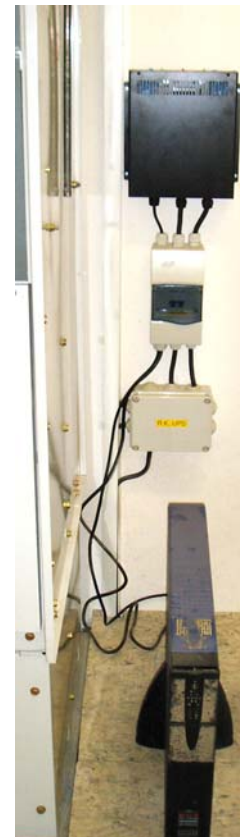
STS EMP 1109 primjer ugradnje na zid